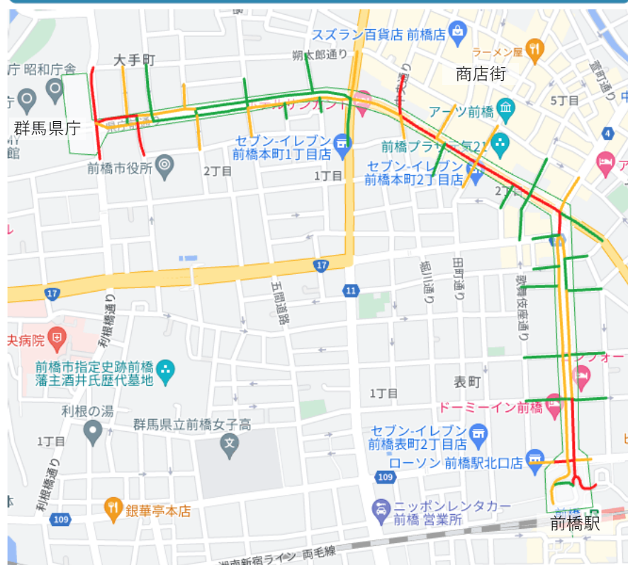
2023年 対象範囲内の通行者(メインストリートのみ)